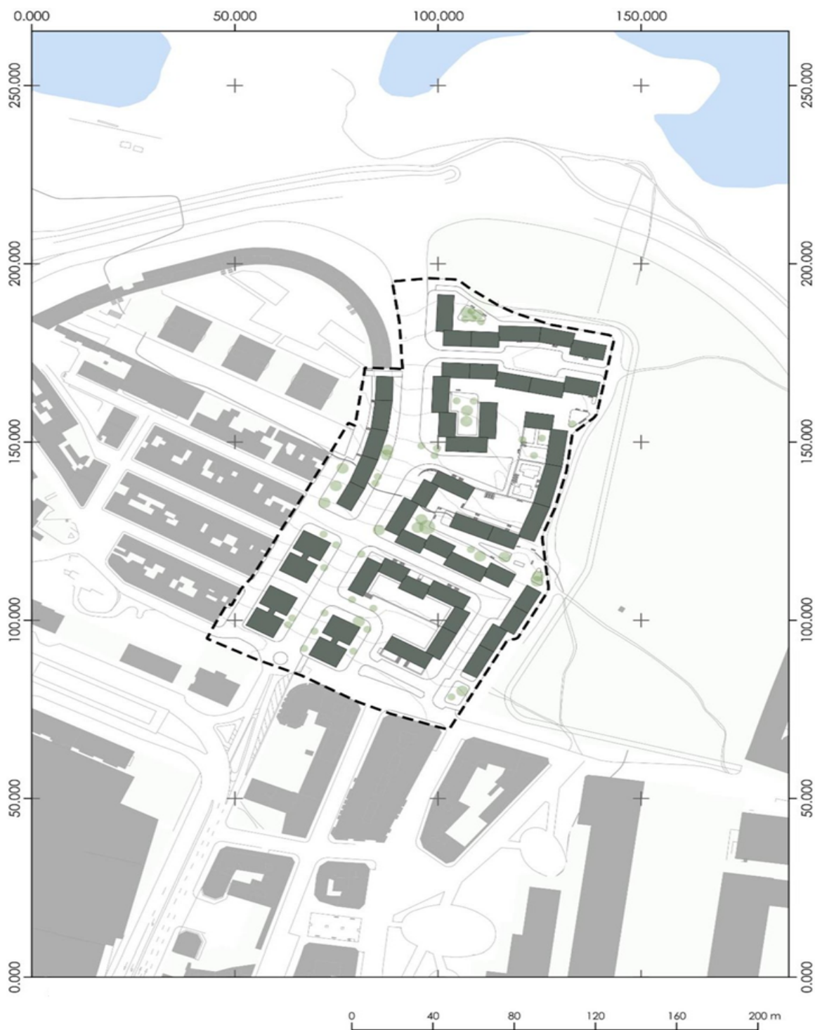
Área de Rehabilitación Integral del Grupo de Viviendas María Pita en Labañou, declarada el 22.07.2015